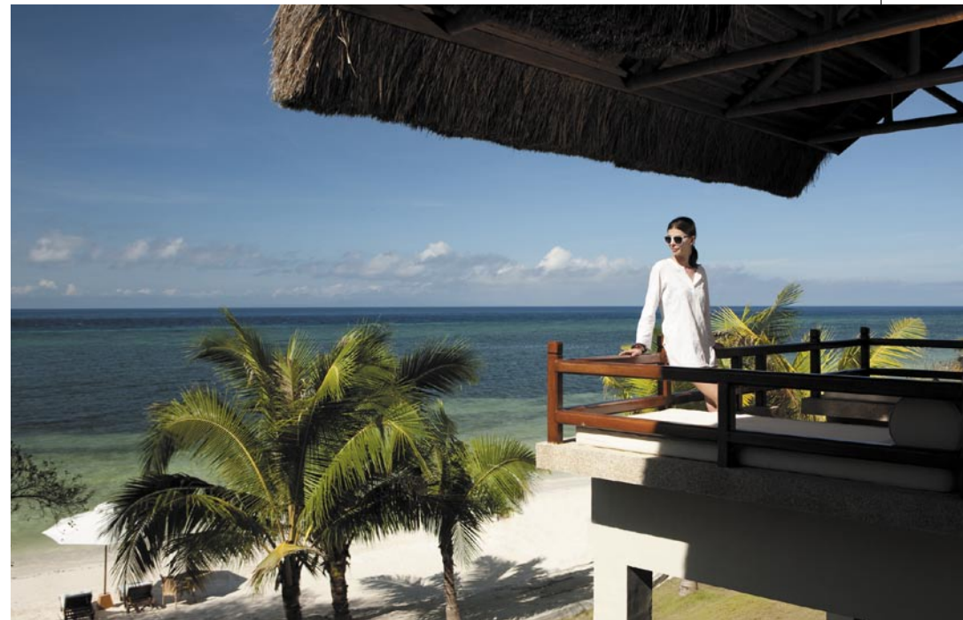
Отель Eskaya Beach Resort&SPA.